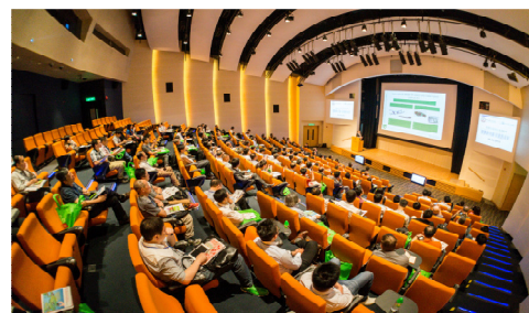
沙田香港科學園 高錕會議中心