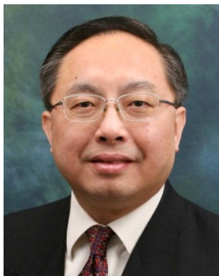
楊偉雄議員 The Honorable Nicholas W. Yang, JP