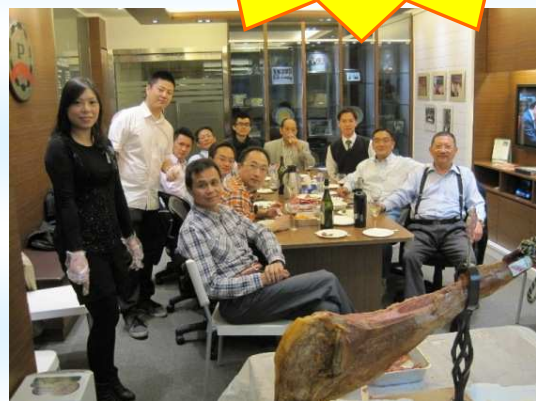
* 以往 HAPPY HOUR 合照